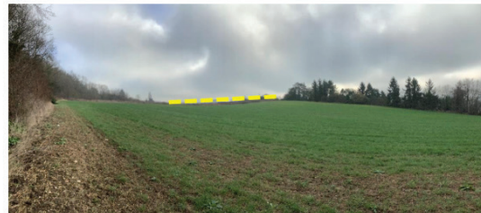
Anomalie de topographie: contre-pente

Les deux anomalies sont associées sur le terrain et permettent aux géologues de proposer des hypothèses sur la géométrie profonde du glissement de terrain puis de l'ausculter par des méthodes géophysiques.